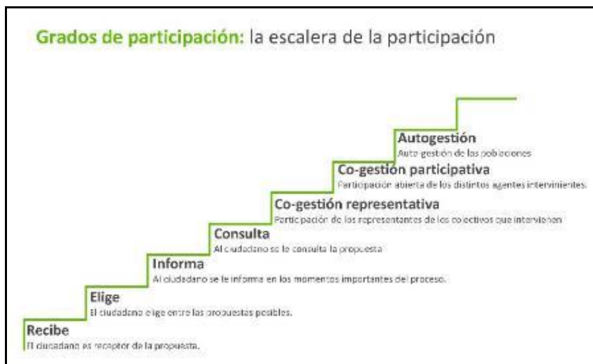
Figura 1. Grados de participación a considerar con los actores en el POMCA Risaralda

participativa en la cual tiene una participación abierta en los distintos agentes que intervienen, y por último la auto gestión de las poblaciones, siendo el nivel de mayor jerarquía de la participación.